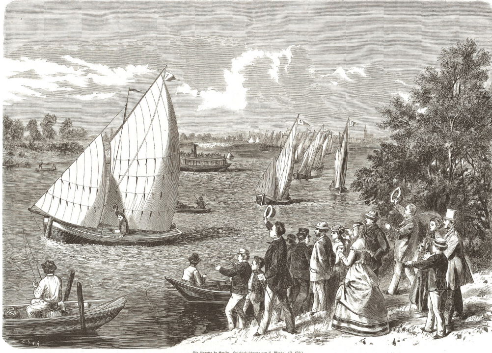
Die Regatta in Berlin. Originalzeichnung von G. Wehbe. (B. 656)

»Und der Schauplatz dieser Wettkämpfe ist jetzt die Wendische Spree?«