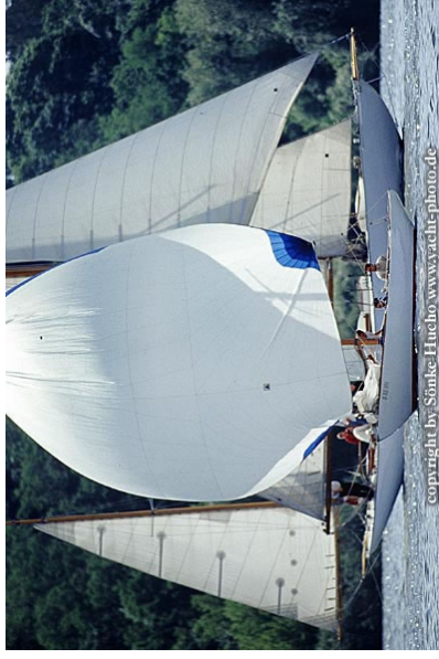
HAVEL KLASSIK - 6mR 'Luv' und 'Prosit IV'