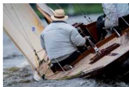
Segler-Wende in den Berliner Ost-West-Gewässern - einst off limits, heute Luv weicht Lee