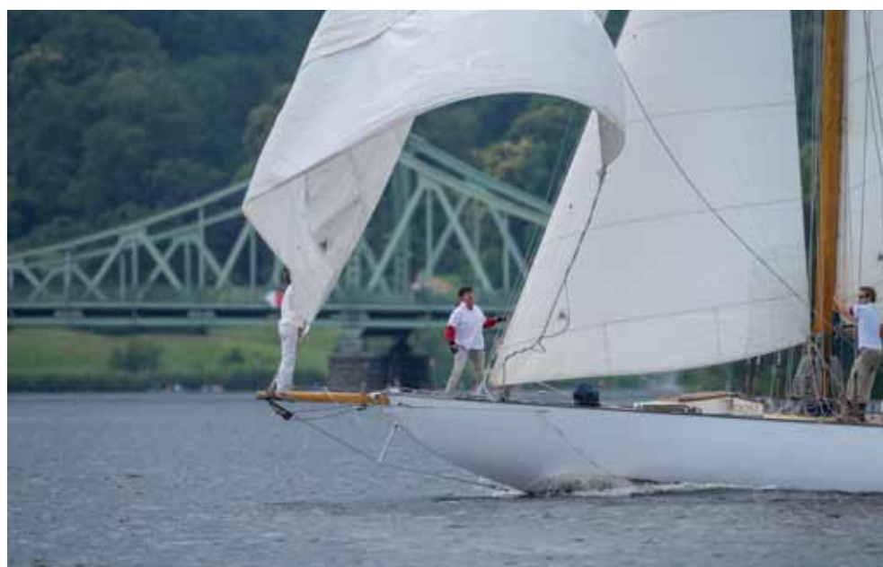
Kult und Kultur in Preußisch-Arkadien-„HavelKlassik“-Flottengewirr hinterm Pfaueninsel-Schlösschen (unten), schnelle H-Jollen „Alt“ unterm Oldie Grunewaldturm (links), 150er Seefahrtskreuzer neben der Glienicker Brücke (rechts oben), im Kalten Krieg Stätte des Agententauschs