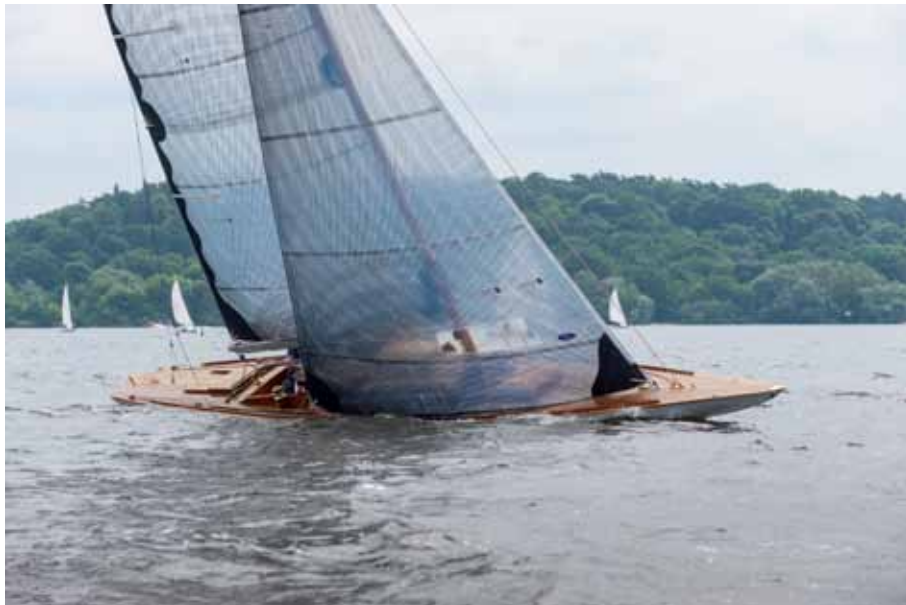
Rechts: 5 mR "Greif" mit brasilianischer Segelnummer BRA 1