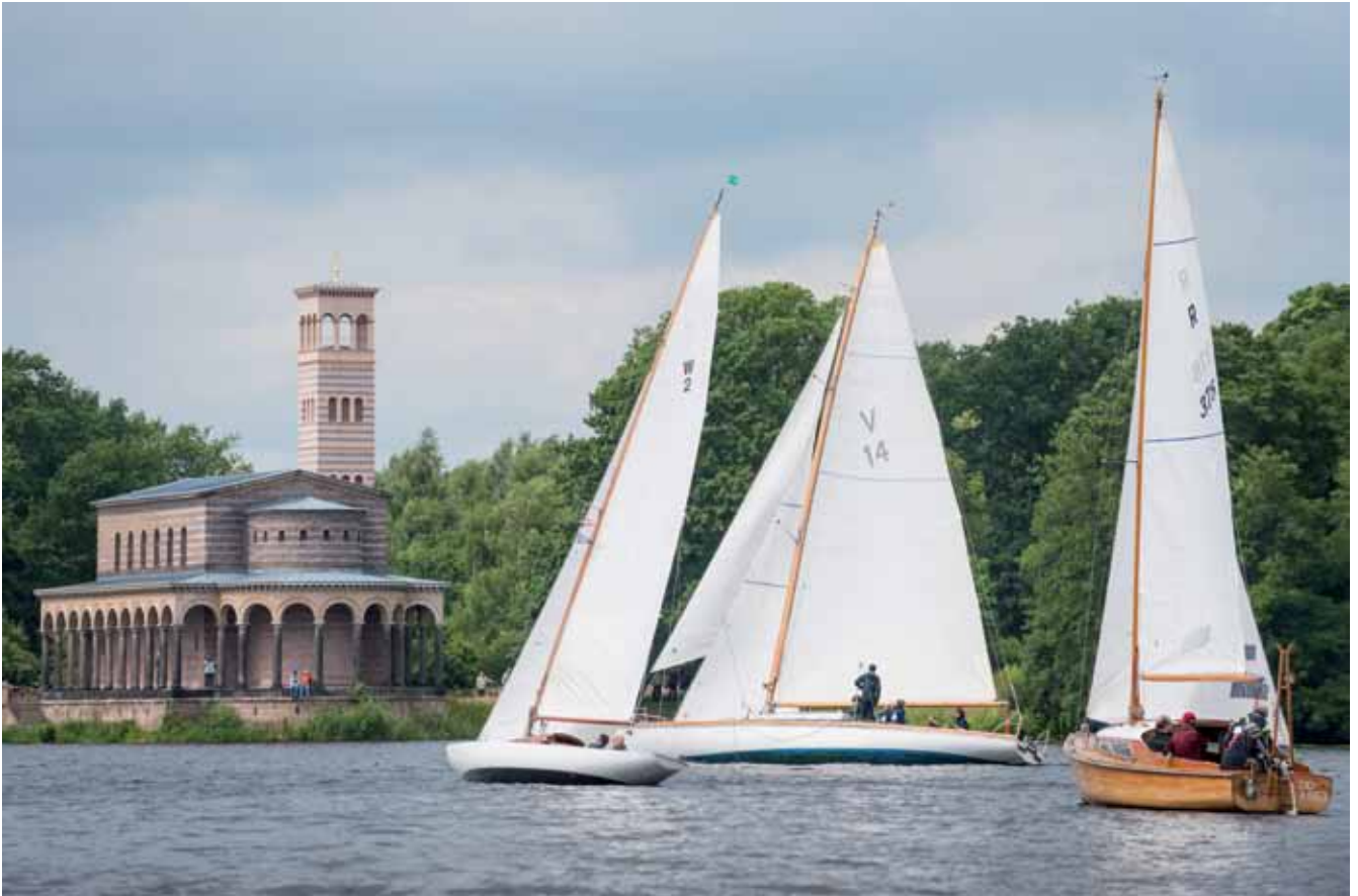
Vorsicht Untiefe - 2013er Veteranen-Luwkampf zwischen 50er Seefahrtskreuzer und W-Klasse vor der alten Heilandskirche (Ost)