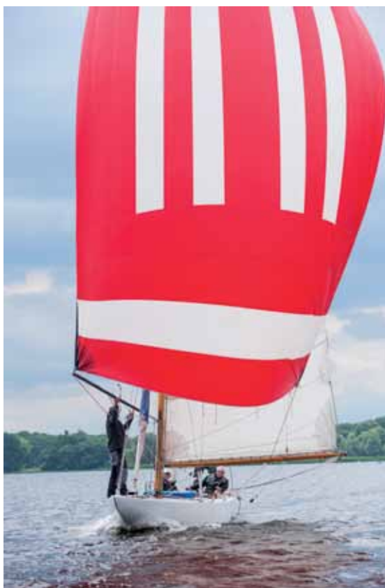
Man sieht sich zweimal- 6mR-Yacht einst auf Mauerstreifen-Exkursion kurz vor der Einheit, nun entspannt auf Wettfahrts-Kurs

Fast 23 Jahre später: Nur eine gute halbe Meile vom damaligen Dialog entfernt wieder Wende, Halse, Wende, dieses Mal in Backbord der Lennéschen Sichtachse zwischen Pfaueninsel-Schlösschen (West) und Marmorpalais (Ost): Unesco-Weltkulturerbe. Rund achtzig Boote der diesjährigen „Havel Klassik“, gestandene Mahagonis, fein ondulierte Schönheiten und schwimmende Steinways darunter, die meisten